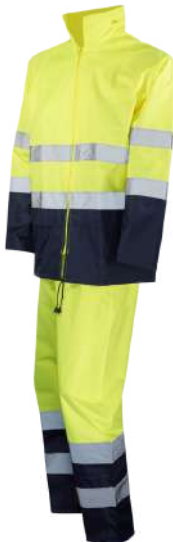
Amarelo AV / Marinho