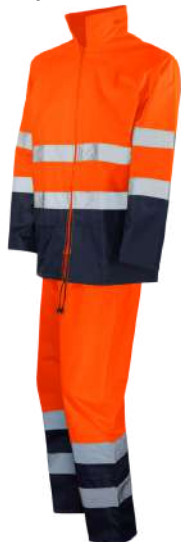
Laranja AV / Marinho